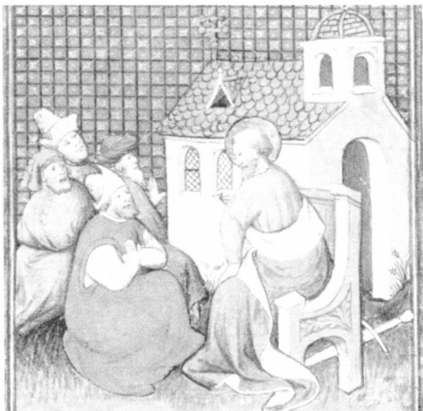
Apostol Pavao donosi Galaćanima Božju riječ. Minijatura iz Biblije. 15. stoljeće

Na to mu je sveti Franjo objasnio: "Ako bi ovu riječ trebalo posve uopćeno shvatiti, ja bih to sažeo ovako: Božji sluga mora svojim svetim životom postati tako snažnom vatrom da svjetlom svoga dobrog primjera i govorom, kojim govori njegovo obraćenje, sve bezbožnike pogodi u njihovoj savjesti. Tako će, mislim, sjaj njegova života i miomiris njegova dobroga glasa svima objaviti njihovu grešnost." To je učenjaka oduševilo. Kad se pozdravljao, rekao je drugovima svetoga Franje: "Braćo moja, teologija ovoga čovjeka, utemeljena na čistoći i razmatranju, je leteći orao, a naša znanost gmiže na trbuhu po zemlji." (2 C 103).