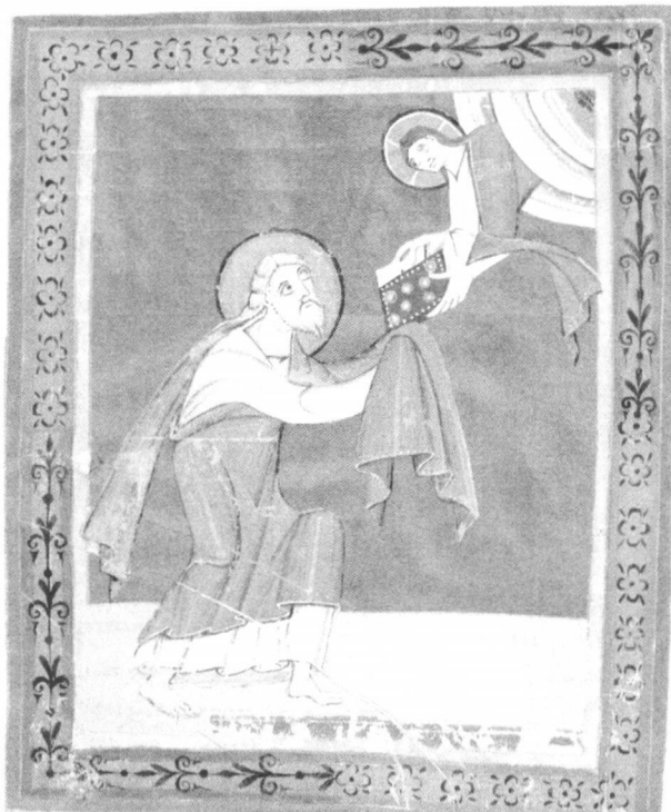
Ivanovo Otkrivenje iz bamberske Apokalipse, oko 1000.

đaje njegova života i otkrio je da je stalno bio voden nadahnućem Duha Svetoga. Stoga nam on ne nudi apstraktnu raspravu, nego jednu intimnu autobiografiju milosti, u kojoj nam neprestano govori: Bog mi je objavio, - on mi je pokazao, - on me vodio.