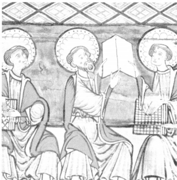
Tri apostola pružaju spise Novog zavjeta. Slika iz 13. st. Crkva u Torpu, Hallingdal, Norveška

Takvo približavanje odgovara franjevačkoj tradiciji. Uspjeh Bernardina Sijenskoga ne treba tražiti