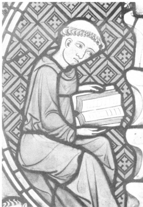
Sv. Franjo. Königsfelden, oko 1330.

Naviještanje svetoga Franje i njegove zajednice bilo je nešto posve drugačije. Barem su u početku samo neka braća prakticirala "praedicatio". Nego, općenito je u franjevačkom bratstvu bila uobičajena "exhortatio", jedna vrsta poziva na pokoru koja je više sličila pjesmi nego propovijedi.