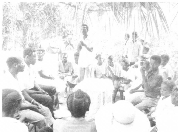
Iz: Franziskaner Mission , 3/94.

Mala je zajednica, dakle, mjesto naviještanja. Ovim malim mjesnim zajednicama moraju služiti franjevački orijentirana braća i sestre. Tako se