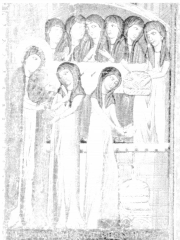
Sv. Klara. Cimabue, 13. stoljeće

Prije svega, naviještanje mora uslijediti svjedočenjem. To se, naprimjer, događa kad kršćanin ili skupina kršćana usred ljudske zajednice u kojoj žive izražavaju svoju životnu i sudbinsku zajednicu s drugima, svoju solidarnost u naporima svih za sve što je plemenito i dobro. Nadalje, i tako što oni sasvim jednostavno i spontano potvrđuju svoju vjeru u vrednotama koje