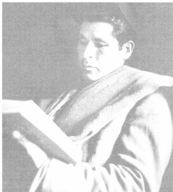
Iz: Adveniat-Dokumente 27, 1984.

Naravno, moraju se pažljivo pratiti vijesti u novinama, časopisima i televiziji, kao i analize stanja našega društva. Međutim, produbljenju spoznaju