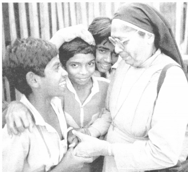
Iz: Alle Welt , 3-4/92.

Za ovo nije bila potrebna nekakva posebna izobrazba, nego se na ovaj način moglo, kad se mislilo da je potrebno, svjedočiti za Krista (usp. NBR 21). Pravo i ovlast na poziv na pokoru nisu dolazili iz neke službe u Crkvi, nego su bili rezultat stila življenja.